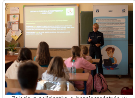
Zajęcia z policjantką o bezpieczeństwie w internecie