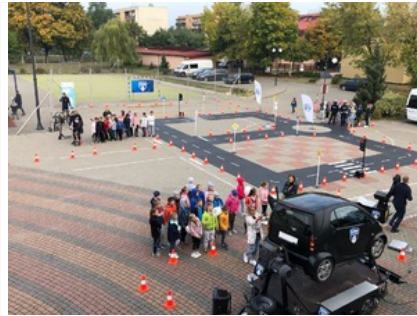
Miasteczko ruchu drogowego w ramach akademii