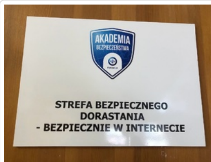
Strefa Bezpiecznego Dorastania