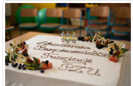
Tort z okazji 100-tnej edycji Akademii Bezpieczeństwa Fundacji PZU