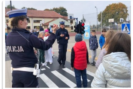
Policjantki o bezpieczeństwie w ruchu drogowym