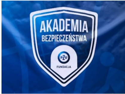
Akademia Bezpieczeństwa Fundacji PZU