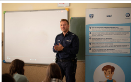
Zajęcia z policjantem o handlu ludźmi