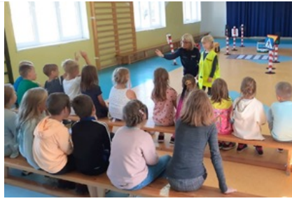
Spotkanie z uczniami Szkoły Podstawowej w Trzonkach