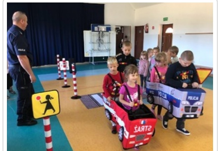
Spotkanie z uczniami Szkoły Podstawowej w Trzonkach