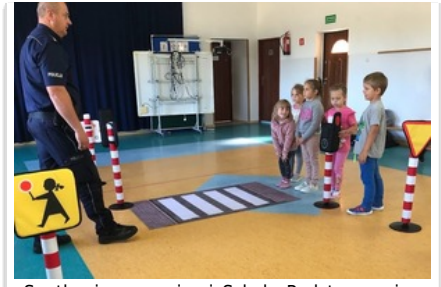
Spotkanie z uczniami Szkoły Podstawowej w Trzonkach