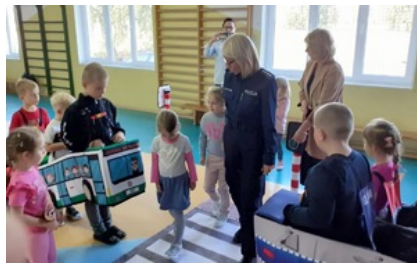
Spotkanie z uczniami Szkoły Podstawowej w Trzonkach