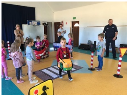
Spotkanie z uczniami Szkoły Podstawowej w Trzonkach