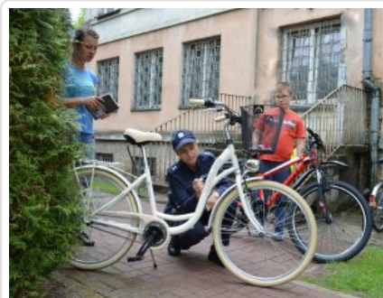
Znakowanie roweru przez policjantkę