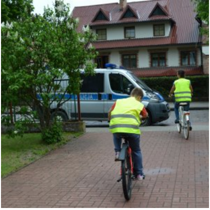
Rowerzyści w kamizelkach odblaskowych