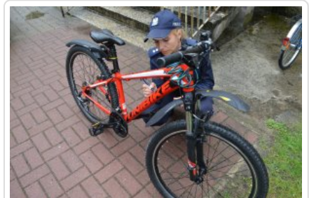
Kolejny oznakowany rower